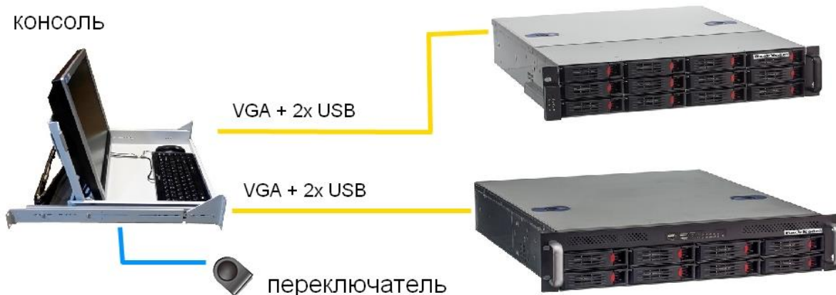
Схема подключения консоли RN-KVM17-S:

Переключение между серверами в консоли осуществляется: